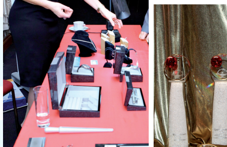
Celý večer lákala hosty prezentace diamantů