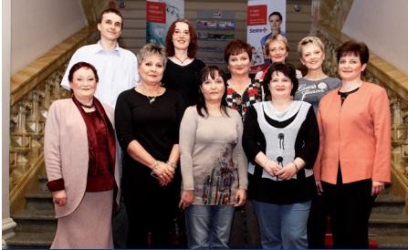
Finalisty čeká nabitě odpoledne a večer