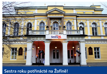
Sestra roku potřinácté na Žofíně!