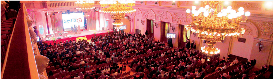
Rok se sešel s rokem a je zde vyhlášení výsledků soutěže Sestra roku 2012. Plný sál v očekávání věcí příštích...