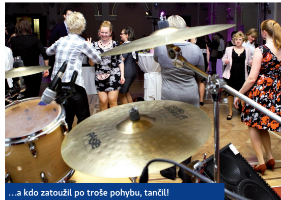
...a kdo zatoužil po troše pohybu, tančil!