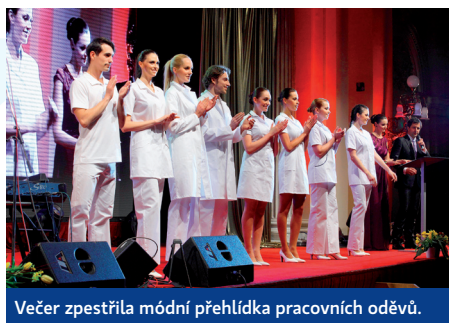
Večer zpestřila módní přehlídka pracovních oděvů.