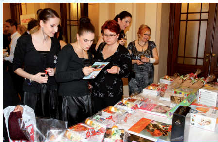
Novinkou letošního ročníku byla bohatá tombola.