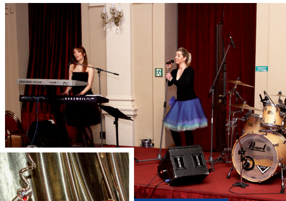
V Malém sále hrála k tanci kapela April