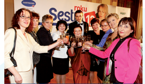
Vivat Sestry roku aneb Společný přípitek finalistů