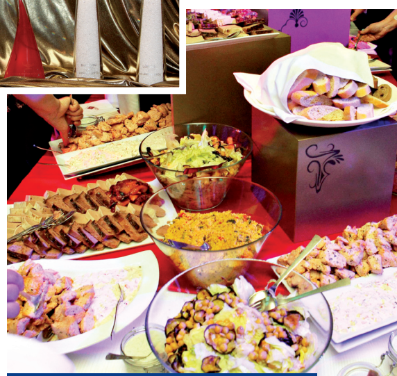
Po náročném večeru přišel čas na občerstvení...