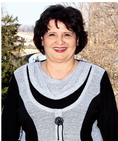
Bc. Vladimíra Havlová